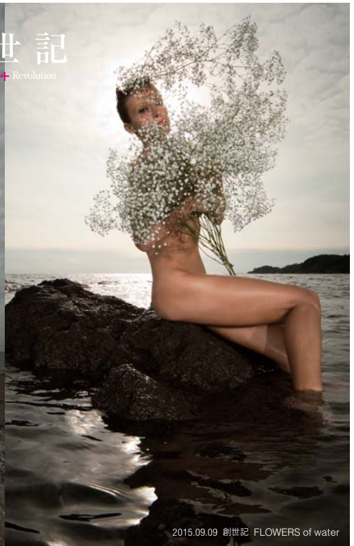
2015.09.09 創世記 FLOWERS of water